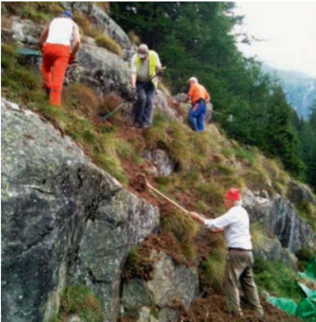
Räumen von losem brennbarem Material (Moos, Tannennadeln etc.) an den Hängen bergseits des Trassees, um die Brandgefahr zu reduzieren / Déblayement du matériel inflammable (mousse, aiguilles de sapin, etc.) côté amont de la voie pour diminuer le risque d'incendie.