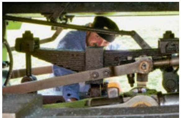
Es kann ganz gut sein, hie und da den Durchblick zu haben