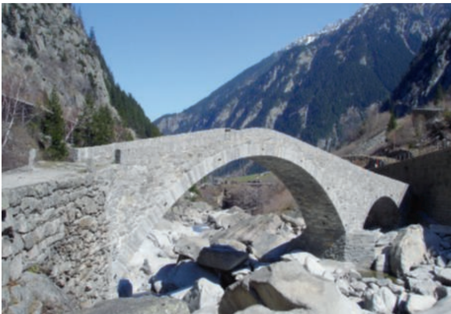
ViaSuworow: Die Häderlisbrücke am unteren Ausgang der Schöllenschlucht. / ViaSuworow : le pont Häderlis à la sortie inférieure des Schöllenen.

chenen, die St. Josefskapelle in Wattigen und die Kirche von Wassen zu den zahlreichen Sehenswürdigkeiten dieser Wanderung.