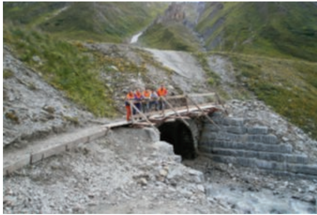
Schlussfoto der Samstagsmannschaft Photo finale de l'équipe du samedi

En ligne, entre le viaduc de Lammen et Oberwald pour débroussailler soigneusement les abords de la ligne afin de prévenir d'éventuels feux de broussailles au passage du train. Au cours de cette opération, nous avons curé le fos-