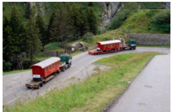
Das Doppelpack in der Schöllenen Schlucht