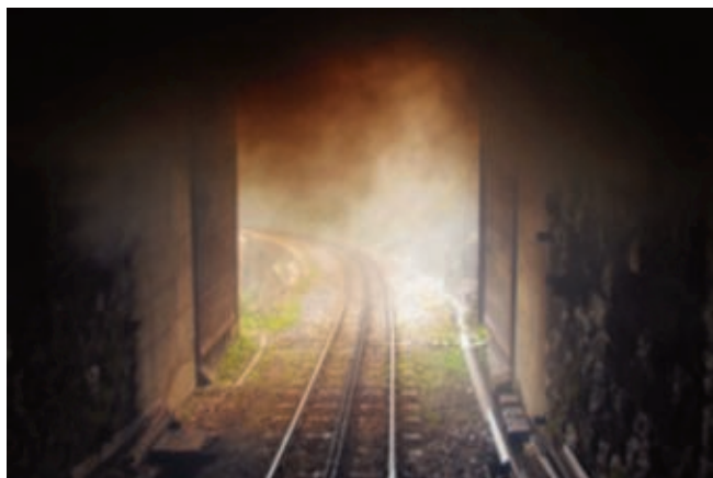
Sicht aus dem hintersten Wagen nach der Einfahrt in den «Alt Senntumstafel-Tunnel»