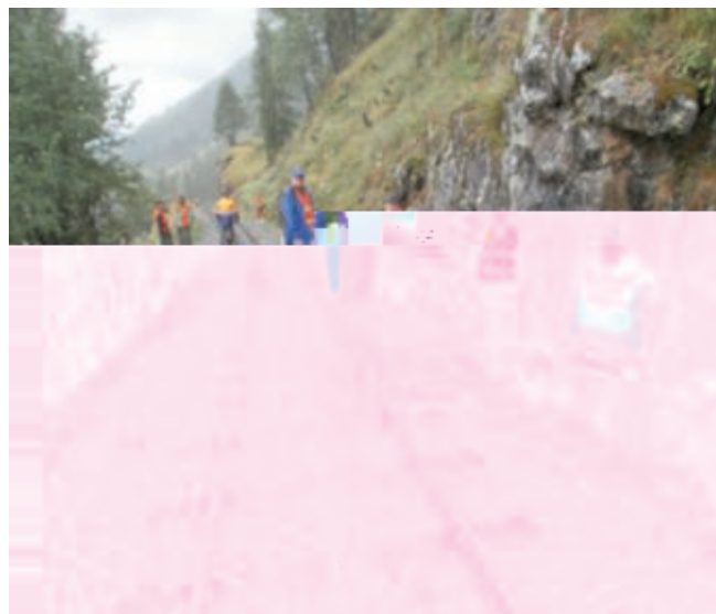
Reinigungsarbeiten am Gleis / Travail nettoyage voie

À la station de Muttbach Belvédère, il s'agissait de reprendre le couronnement des deux portails du pont sur la rivière Mutt. Les effets conjugués du froid, de la pluie et de la neige ont mis à mal les deux couronnements en pierre de taille. Il a donc été nécessaire de créer, en amont et aval un cheminement d'approche sur ces deux parties de chantier pour dégager la terre et mettre à nu une partie de la voûte. Côté amont un chemin d'accès a été créé sans trop de difficultés et le dégagement a commencé.