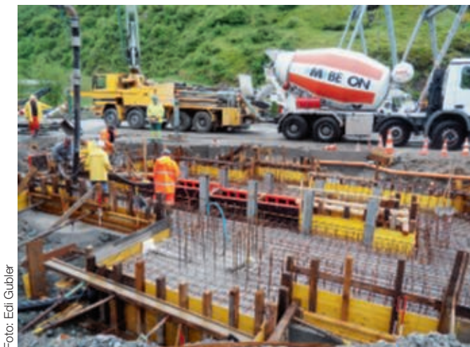
Depot Realp: Betonieren Boden Bekohlungsanlage / Dépôt Realp : bétonnage du sol de la station de soutage de charbon

Zwischenverpflegung. Auch die beiden Kuchen, welche uns Kurt und Madeleine Letter überbrachten, waren vorzüglich. Ich möchte mich als Gruppenleiter bei allen Teilnehmenden für ihren grossen Einsatz bedanken und würde mich freuen, wenn alle mit der gleichen Begeisterung und Kameradschaft im Jahr 2012 in der Woche 22 wieder dabei sein könnten.