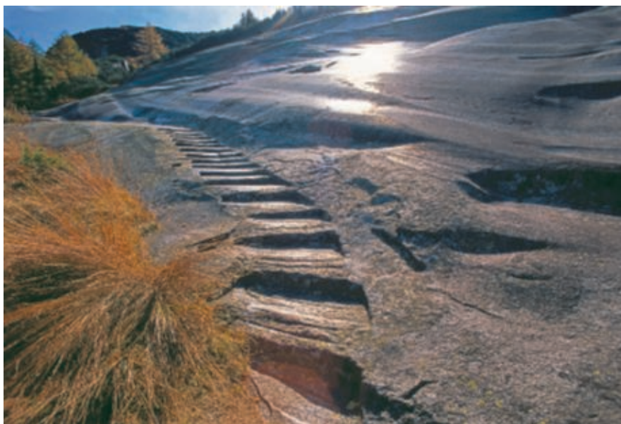
ViaSbrinz: Die in den Fels gehauenen Stufen der Hälenplatte auf der Berner Seite des Grimselpasses gaben den Säumern Halt. / ViaSbrinz : une foulée plus sûre pour les muletiers grâce aux marches taillées dans la roche de la plaque Hälen, sur le versant bernois du col du Grimsel.