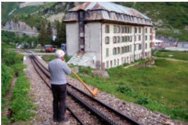
Leo Saladins Weckruf / Diane avec sonnerie de cor des Alpes

An den Drehscheiben standen die jährlichen Unterhaltsarbeiten an. Es mussten die Lagerstellen ge-